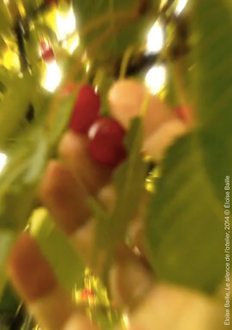
Éloïse Baille, Le silence de l'atelier , 2014 © Éloïse Baille

- L'interrogation : en interviewant des habitant.e.s ou visiteur.euse.s des lieux qui ont des anecdotes, des souvenirs liés au square ou jardin, ou bien des gens qui travaillent dans ces espaces.