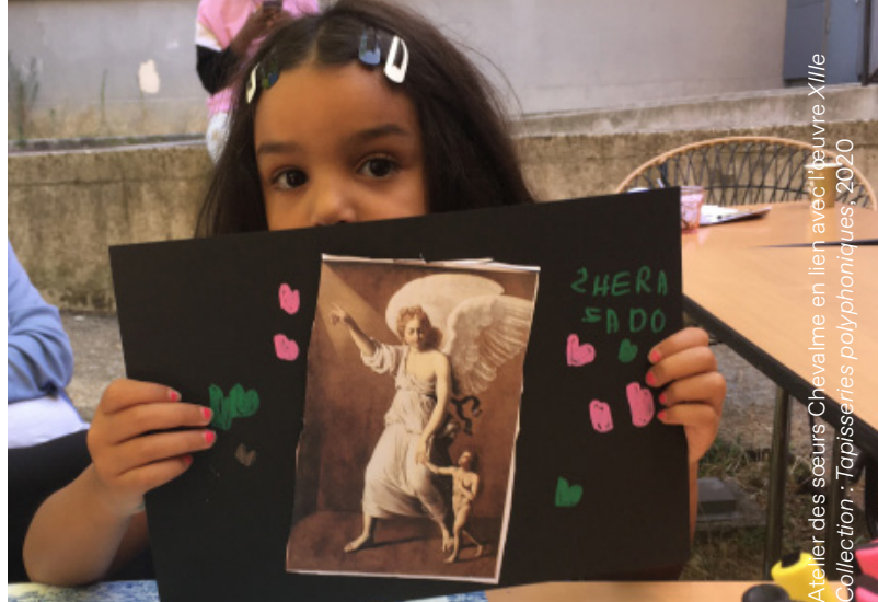
Atelier des sœurs Chevalme en lien avec l'œuvre Xlile Collection : Tapissières polyphoniques, 2020