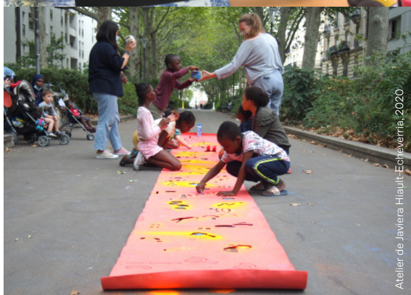
Atelier de Javiera Hiault-Echeverria, 2020